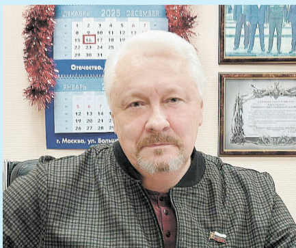
Дорогие жители муниципального округа Левобережный!

От души поздравляю вас с наступающим Новым годом и светлым Рождеством Христовым! Уходящий год был полон важных событий, совместных усилий и значимых достижений. Вместе мы сделали очень многое для того, чтобы родной район стал уютнее и безопаснее.