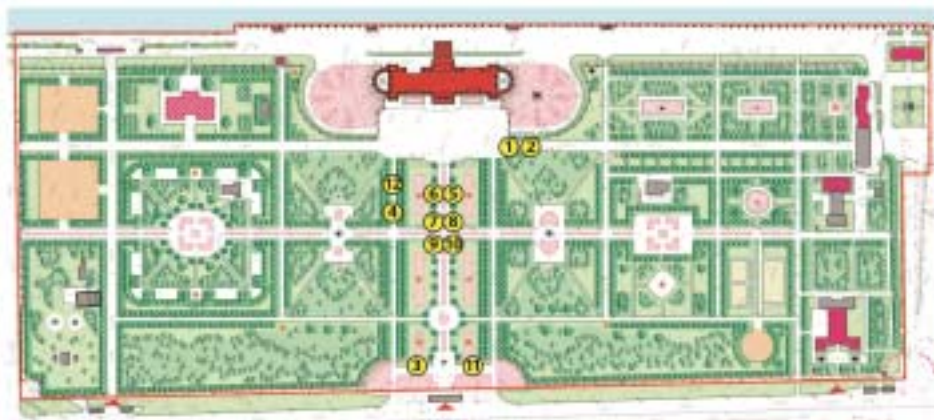
СХЕМА РАЗМЕЩЕНИЯ НЕСТАЦИОНАРНЫХ ТОРГОВЫХ ОБЪЕКТОВ на территории ГАУК г. Москвы "МПК "Северное Тушино" (парк "Северный Речной вокзал")

Приложение к решению Совета депутатов муниципального округа Левобережный от 21.04.2015г. № 5-3